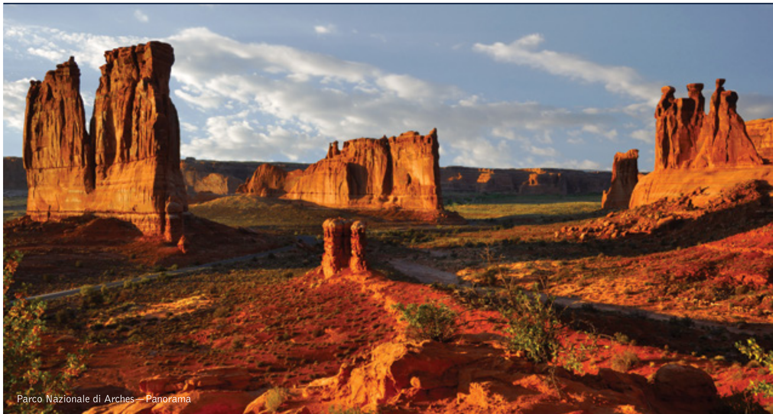
Parco Nazionale di Arches — Panorama

17 giorni / 16 notti. Da aprile a ottobre. Inizio/Fine tour: Los Angeles/New York