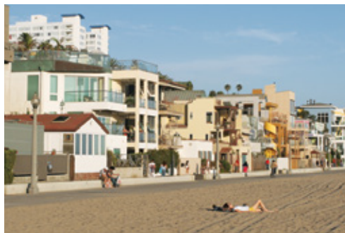
Santa Monica—La spiaggia

17° giorno: New York— Partenza (mercoledì) Colazione americana. Giornata libera. Trasferimento in aeroporto per il volo di ritorno.