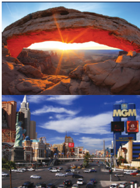
Parco Nazionale Arches — Panorama Las Vegas — Panorama

Date di partenza e prezzi pagina successiva »