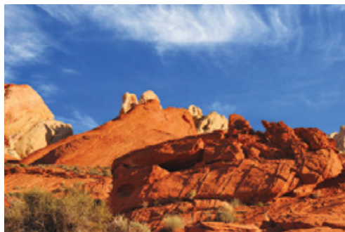
Las Vegas—Il deserto