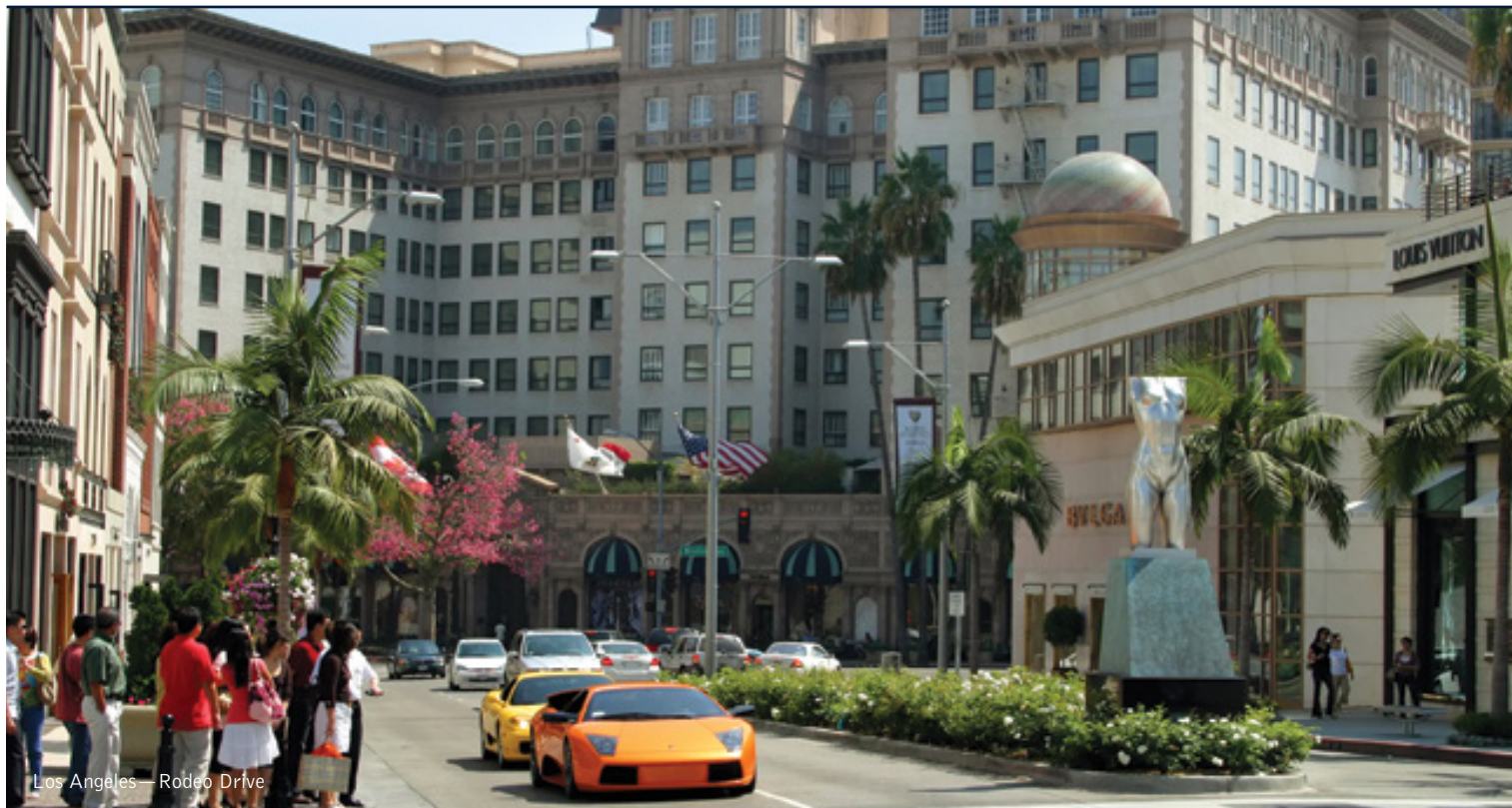
Los Angeles—Rodeo Drive

16 giorni / 15 notti. Da luglio ad agosto. Inizio/Fine tour: Los Angeles/New York