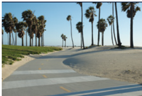
Le spiagge della California Los Angeles—Universal Studios

Date di partenza e prezzi pagina successiva »