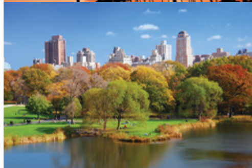
Santa Barbara—Il tramonto New York—Central Park