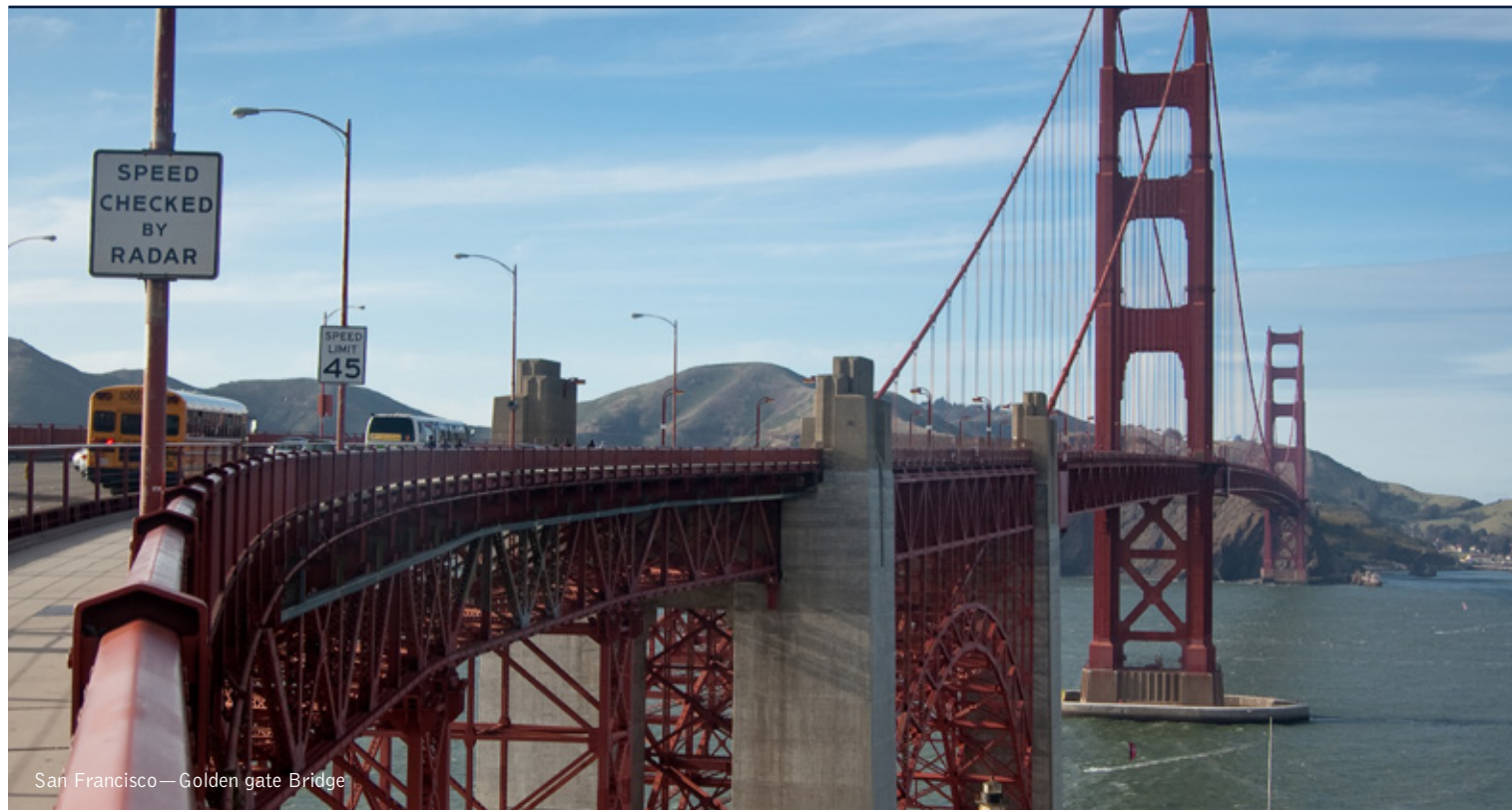
San Francisco—Golden gate Bridge

14 giorni / 13 notti. Da aprile a ottobre. Inizio/Fine tour: Los Angeles/New York