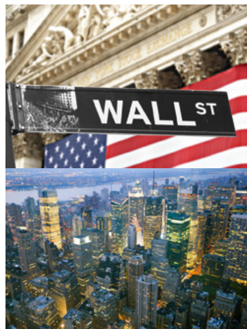
New York— Wall Street New York— Panorama