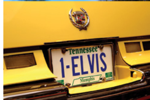
New York—Central Park in autunno Memphis—La targa di una Cadillac