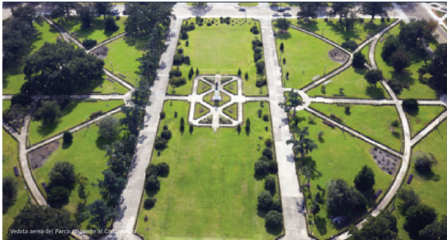
Veduta aerea del Parco adiacente al Campidoglio

12 giorni / 11 notti. Da giugno a settembre. Inizio/Fine tour: New York/New Orleans