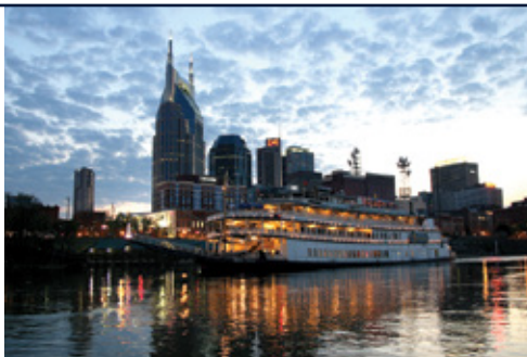
Nashville—Il fiume Cumberland

musicisti come Johnny Cash, Elvis, Carl Perkins, B.B. King, Jerry Lee Lewis. Il tour prosegue verso il centro città, sulle rive del Mississippi, dove venne assassinato Martin Luther King Jr. Sia che desideriate ascoltare della buona musica o gustare la cucina tipica del sud (il barbecue!) la città saprà accontentarvi.