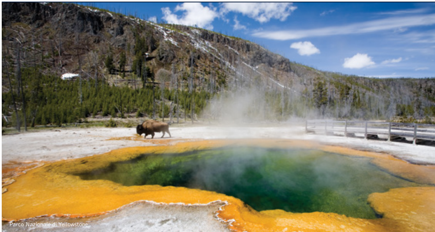
Parco Nazionale di Yellowstone

15 giorni/14 notti. Da giugno ad agosto. Inizio/Fine tour: Denver