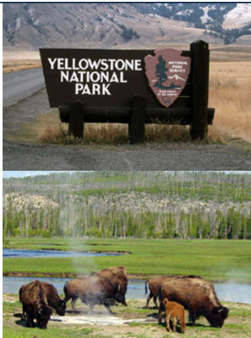
Parco Nazionale di Yellowstone

Per questo motivo, nel 1880, il famigerato ladro William C. "Teton" Jackson decise di nascondersi in questi luoghi ormai dimenticati e, da quel momento