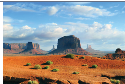
Parco Nazionale di Monument Valley

È possibile acquistare la versione di 10 giorni/ 09 notti senza le notti ed attività previste su Los Angeles (quotazione su richiesta), in questo caso il tour si può interrompere il 10° giorno a Phoenix oppure rientrare su Los Angeles con il gruppo ma con servizi liberi in arrivo da poter impostare autonomamente. Le escursioni facoltative sono prenotabile e pagabili solo in loco, i prezzi sono soggetti a riconferma da parte della guida.