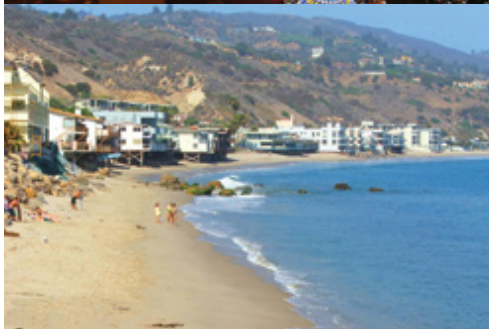
Las Vegas—Panorama notturno Los Angeles—La spiaggia di Malibu