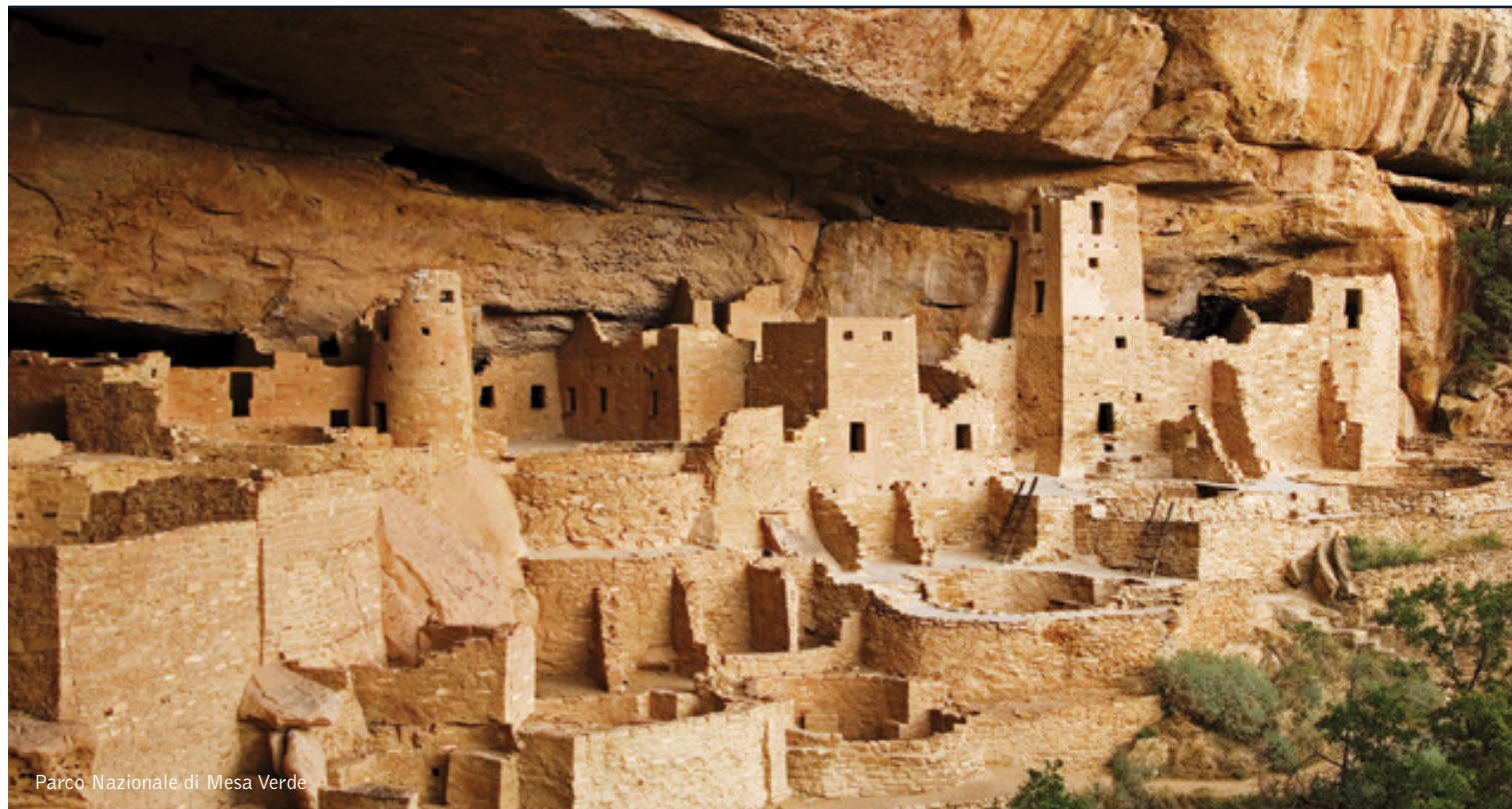
Parco Nazionale di Mesa Verde

9 giorni /8 notti. Da maggio a settembre. Inizio/Fine tour: Las Vegas/Los Angeles