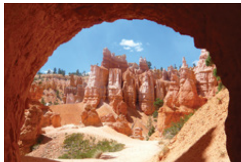
Parco Nazionale del Bryce Canyon, UT—Panorama

Bambini vengono accettati dagli 8 anni compiuti. L'incontro con la guida è previsto il 3° giorno nella lobby del Harrah's Las Vegas alle 07.30 per partire alle 08.00.