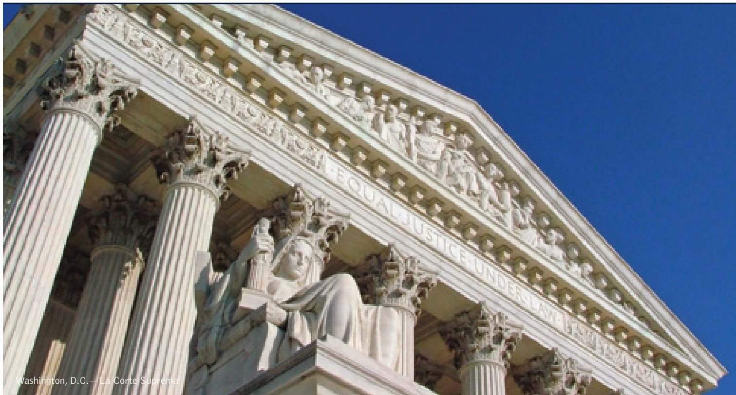
Washington, D.C.—La Corte Suprema

9 giorni / 8 notti. Da aprile a ottobre. Inizio/Fine tour: New York