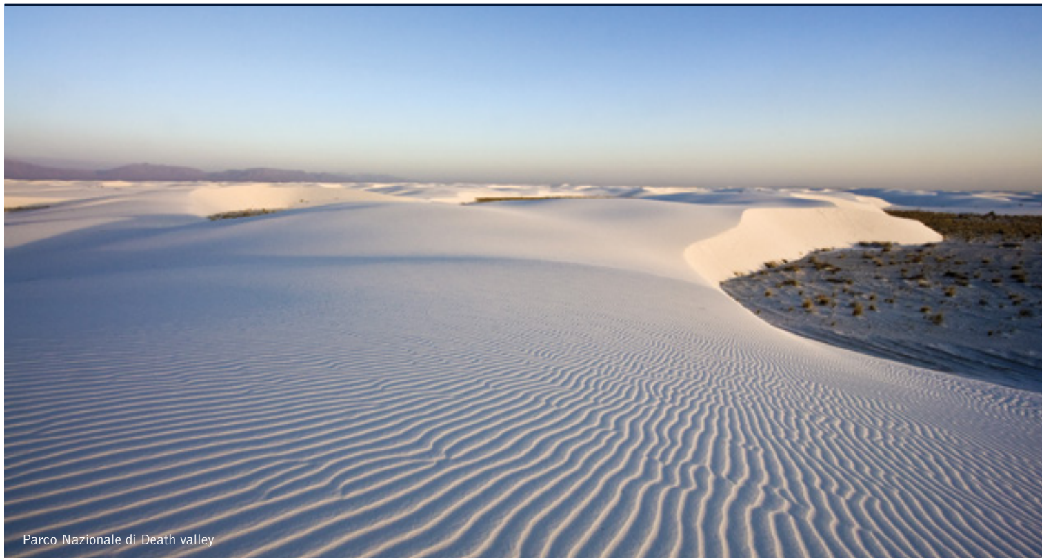
Parco Nazionale di Death valley

16 giorni / 15 notti. Da maggio a settembre. Inizio/Fine tour: Los Angeles/New York