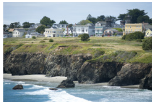
Mendocino—La costa californiana

Colazione americana. Giornata libera. Trasferimento in aeroporto per il volo di ritorno.