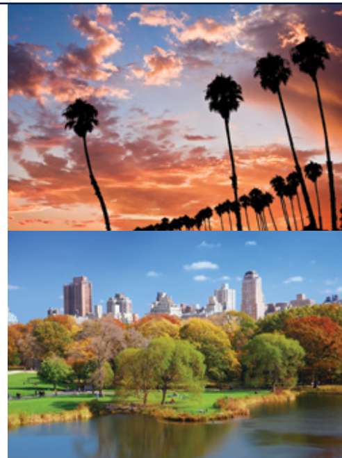
Santa Barbara—Il tramonto New York—Central Park

soluzione assolve la doppia funzione di far risparmiare una notte in hotel ed offrire giornate piene nella città di partenza (San Francisco) e di destinazione (New York). In questo caso il check-out dall'hotel di San Francisco avverrà verso le ore 11:00 e i passeggeri potranno utilizzare la stanza di deposito dei bagagli (costo indicativo Usd 10,00 a bagaglio depositato), utilizzando a loro piacimento la giornata in città prima di tornare a prendere i bagagli per imbarcarsi poi sul volo per New York. In relazione all'arrivo a New York, qualora l'hotel non abbia una camera subito disponibile il passeggero dovrà attendere l'orario classico di check-in intorno alle 16:00 utilizzando nel frattempo la stanza di cortesia per il deposito bagagli (costo indicativo Usd 10,00 a bagaglio depositato) per iniziare subito in autonomia la visita della città. Posizionare l'estensione a fine tour, a nostro avviso serve inoltre a far decongestionare i passeggeri in coda al viaggio dai ritmi del tour precedentemente effettuato.