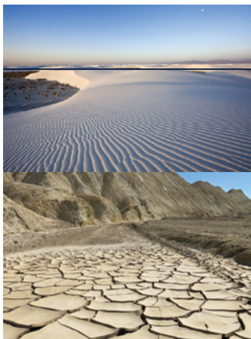
San Francisco—Il Golden Gate Bridge Parco Nazionale di Monument Valley