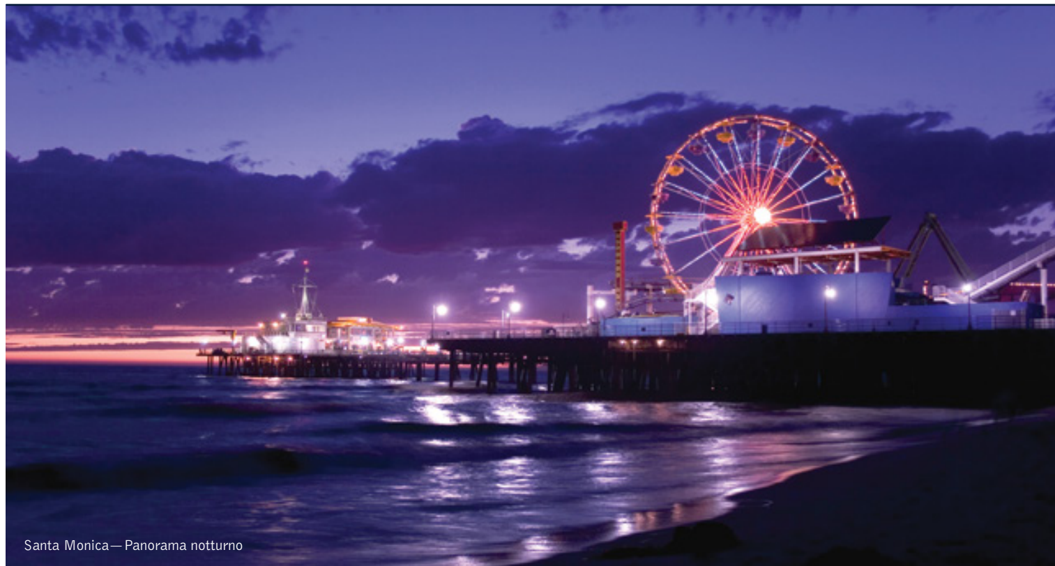
Santa Monica—Panorama notturno

11 giorni / 10 notti. Da aprile a ottobre. Inizio/Fine tour: Los Angeles/San Francisco