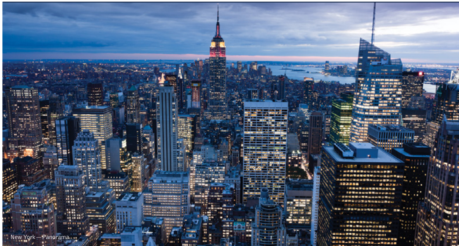
New York — Panorama

18 giorni / 17 notti. Da aprile a ottobre. Inizio/Fine tour: Los Angeles/New York