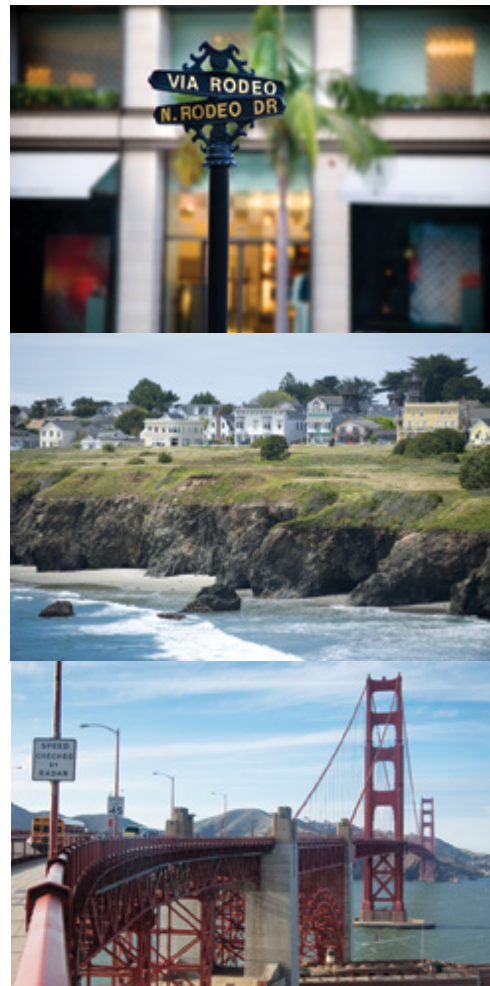
Mendocino—La costa californiana Los Angeles—Rodeo Drive San Francisco—Il Golden Gate Bridge

Posizionare l'estensione a fine tour, a nostro avviso serve inoltre a far decongestionare i passeggeri in coda al viaggio dai ritmi del tour precedentemente effettuato. Sull'estensione a New York è possibile prenotare per il secondo giorno una visita guidata della città di circa 5 ore e 30 minuti al costo di € 60,00 a persona (partenza dell'escursione alle ore 09:00 dall'hotel Sheraton New York Times Square - possibilità di quotare in questo caso direttamente il predetto hotel come luogo di soggiorno per le 3 notti). Al contrario del costo del tour il cui prezzo è fisso e garantito, il costo dell'estensione a New York è da quotare in via definitiva sulla base del periodo di viaggio scelto, sulla base del costo dei soggiorni alberghieri (Alta stagione su tariffe alberghiere: aprile, maggio, giugno, settembre ed ottobre / Bassa stagione su tariffe alberghiere: luglio e agosto).