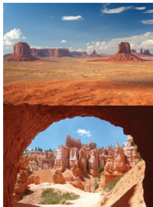
Parco Nazionale di Monument Valley Parco Nazionale del Bryce Canyon

7° giorno: Kanab—Bryce Canyon—Las Vegas (martedì—562 km) Prima colazione. Prima colazione. In mattinata visita del parco di Bryce Canyon, famoso per le sue formazioni rocciose e dove ci fermeremo per il pranzo. Il tour prosegue alla volta di Las Vegas, la scintillante capitale del Gioco d'azzardo che illumina il deserto. Cena libre; possibilità di partecipare a una gita facoltativa della città.