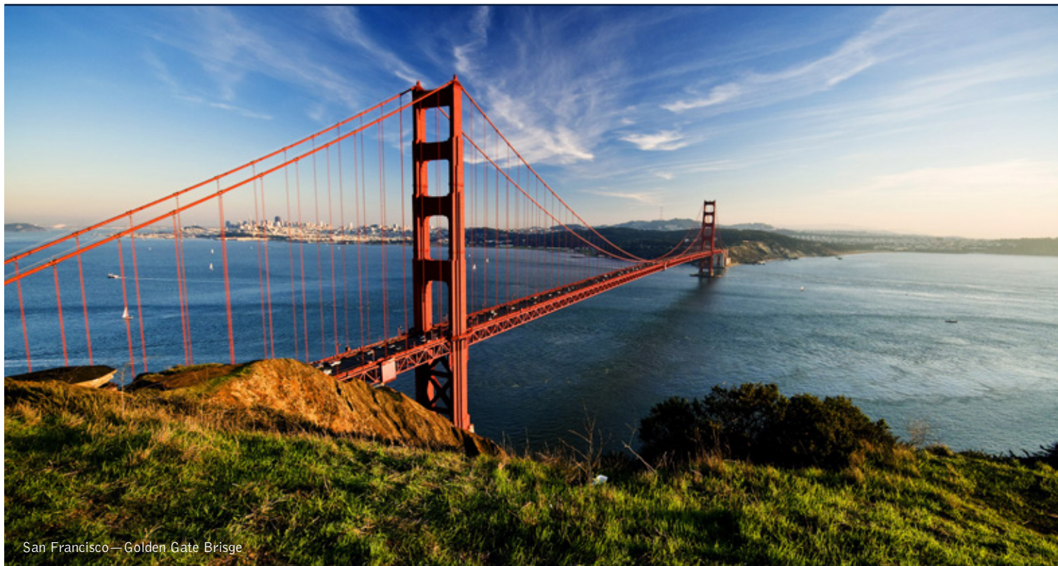
San Francisco—Golden Gate Bridge

14 giorni / 13 notti. Da maggio a settembre. Inizio/Fine tour: Los Angeles/San Francisco