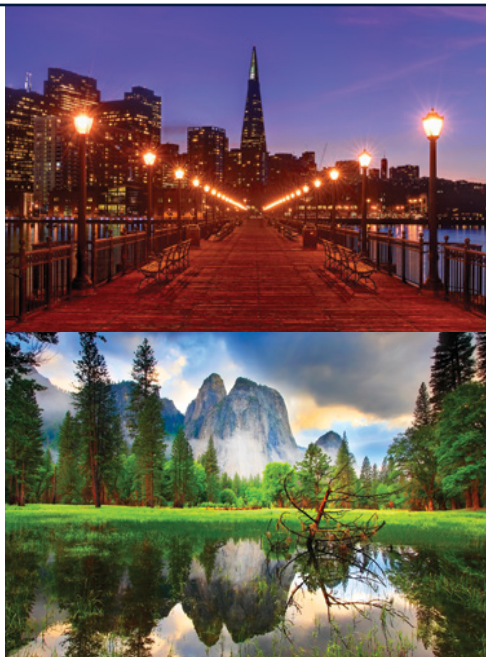
San Francisco — Panorama notturno Parco Nazionale di Yosemite — Panorama

Nella prima mattinata partenza per San Francisco. Tour guidato della città, miscuglio di storia e culture fotografato, filmato e documentato in tutto il mondo.