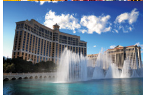
Las Vegas—Panorama notturno Las Vegas—Hotel Bellagio