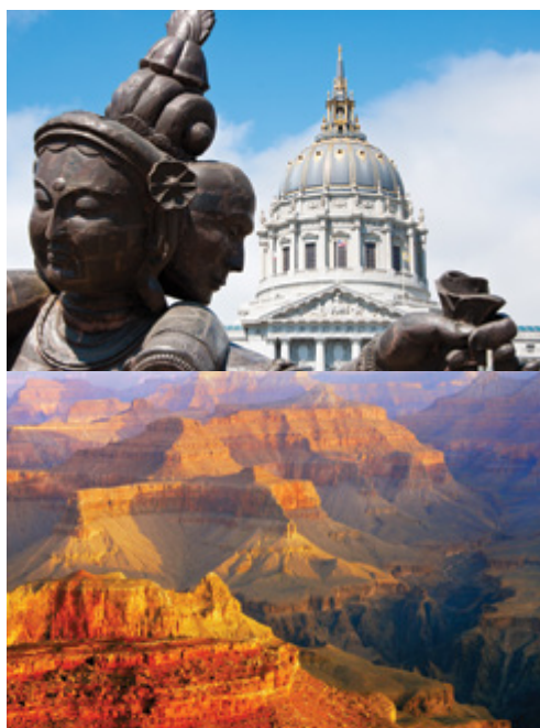
San Francisco—Dettaglio della scultura Buddista Parco Nazionale del Grand Canyon—Panorama