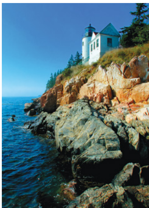
Bar Harbor, ME—Il Parco Nazionale di Acadia

nb: Escursioni prenotabili e pagabili solo in loco.