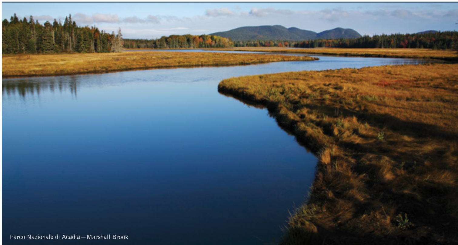
Parco Nazionale di Acadia—Marshall Brook

9 giorni / 8 notti. Da giugno a settembre. Inizio/Fine tour: Boston