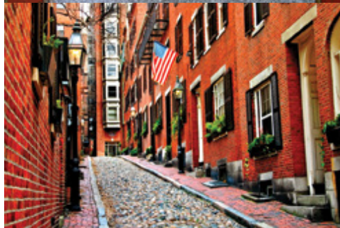
Boston—Il Freedom Trail Boston—Il caratteristico quartiere di Beacon Hill