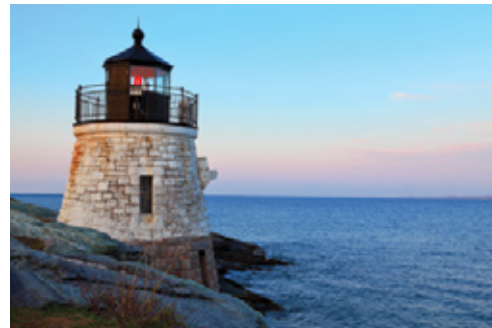
Newport, MA—Il faro di Castle Hill al tramonto