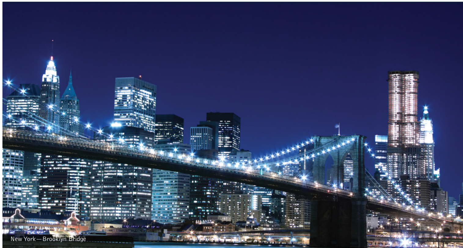
New York — Brooklyn Bridge

5 giorni / 4 notti. Tutto l'anno. Inizio/Fine tour: New York City