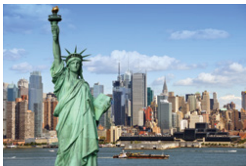
New York—Il porto e, in primo piano, Lady Liberty