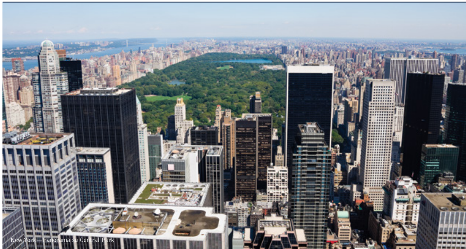
New York — Panorama su Central Park

5 giorni / 4 notti. Da giugno a dicembre. Inizio/Fine tour: New York City