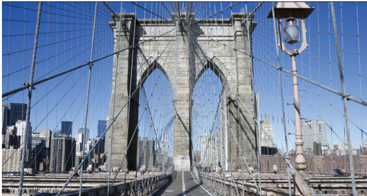
New York — Il ponte di Brooklyn

5 giorni / 4 notti. Da aprile a dicembre. Inizio/Fine tour: New York City