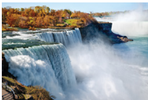
Cascate del Niagara—Il versante americano

Tariffe aeree nazionali/ internazionali; Quota d'iscrizione e assicurazione medico/ bagaglio € 60 (ne vengono applicate massimo 2 per camera); I pasti, le bevande, gli extra in genere, le mance e tutto quanto non espressamente indicato nel programma; Spese personali come lavanderia, telefonate, escursioni facoltative.