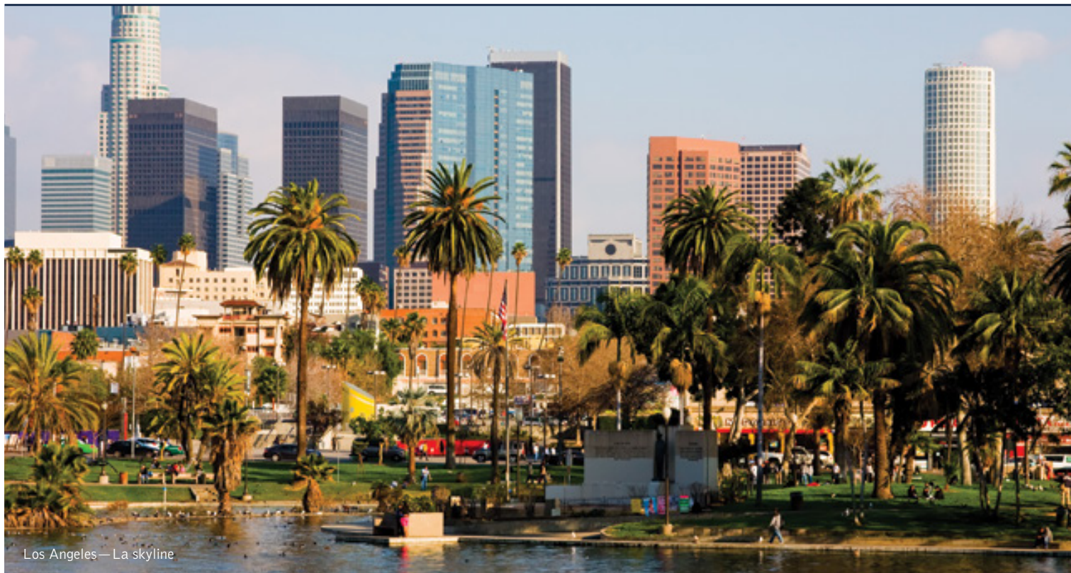
Los Angeles—La skyline

9 giorni / 8 notti. Da aprile a ottobre. Inizio/Fine tour: Los Angeles