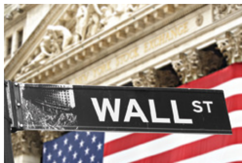
New York—Wall Street