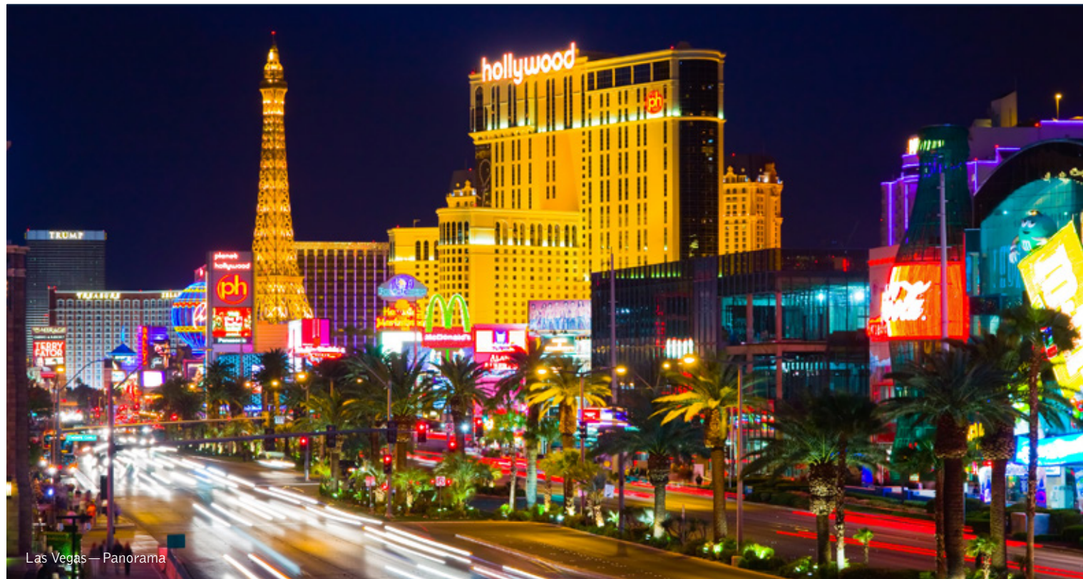
Las Vegas — Panorama

13 giorni / 12 notti. Da aprile a ottobre. Inizio/Fine tour: Los Angeles/New York