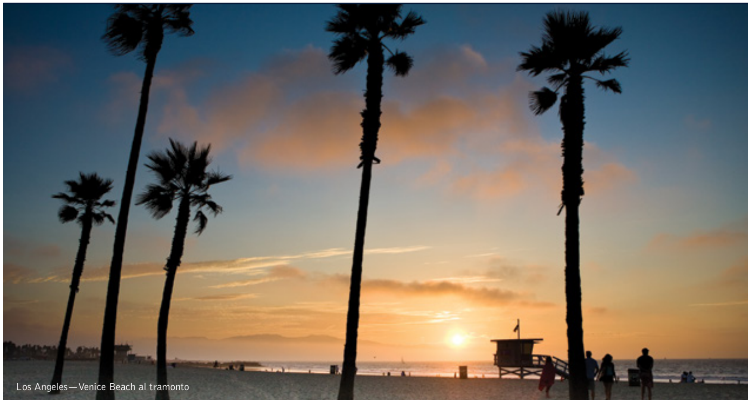
Los Angeles—Venice Beach al tramonto

8 giorni / 7 notti. Da aprile a ottobre. Inizio/Fine tour: Los Angeles/Las Vegas