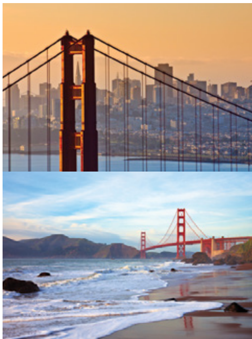
San Francisco—Il Golden Gate Bridge

Prima colazione. In base all'orario di partenza potreste aver tempo per lo shopping dell'ultimo minuto. Trasferimento in aeroporto con navetta messa a disposizione dall'hotel.