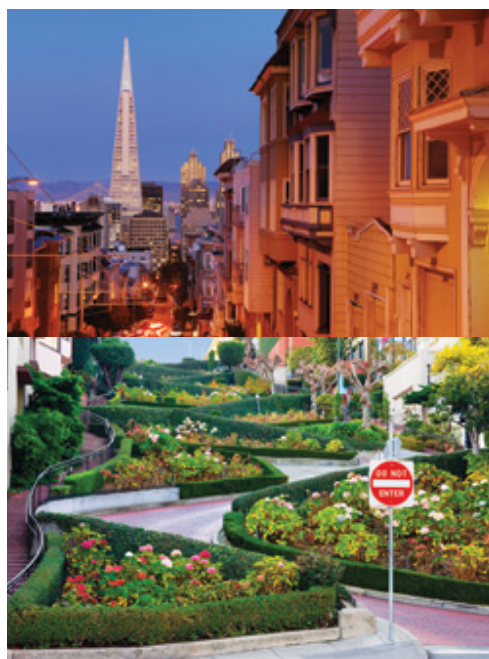
San Francisco—via del Sacramento al tramonto San Francisco—Lombard Street

La nostra prossima tappa è la City of Angels, ovvero Los Angeles. Visiteremo le attrazioni principali, come il Grumman's Chinese Theatre, Beverly Hills o Rodeo Drive, il paradiso dello shopping. Tenete gli occhi aperti e le fotocamere a portata di mano: potrebbe non essere difficile avvistare una celebrità! Visiteremo inoltre Olvera Street e Santa Monica, dove termina la Route 66.