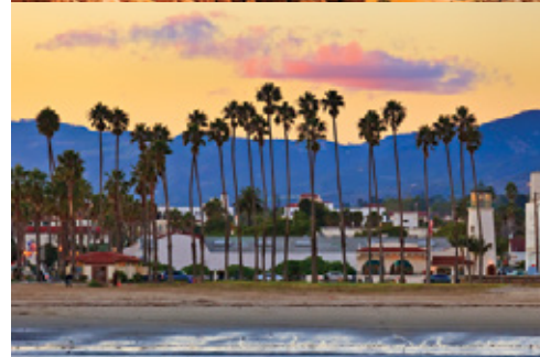
Parco Nazionale del Bryce Canyon—Panorama Los Angeles—La spiaggia