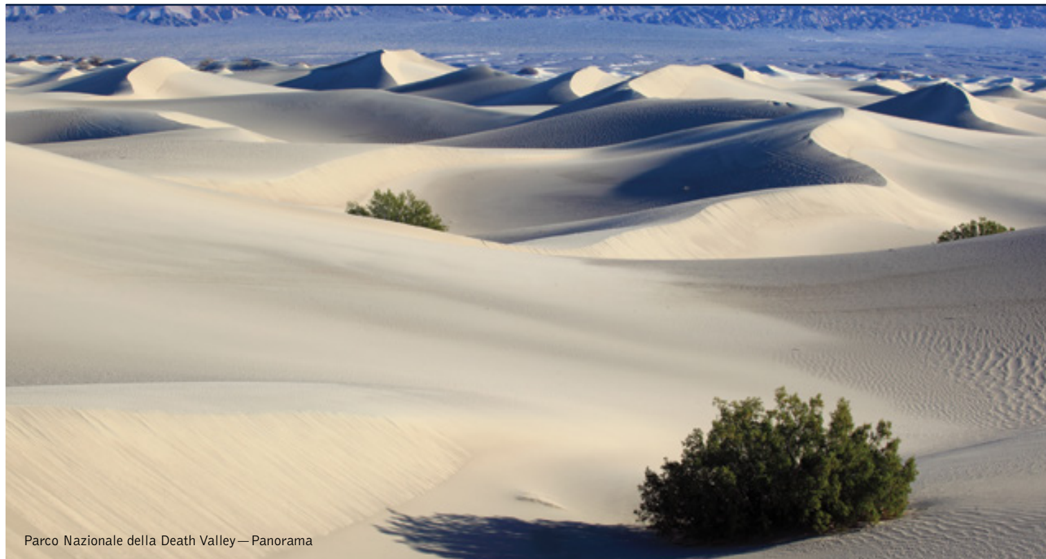
Parco Nazionale della Death Valley — Panorama

11 giorni /10 notti. Da maggio a settembre. Inizio/Fine tour: San Francisco/Los Angeles