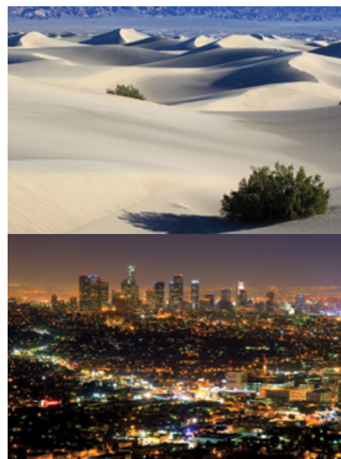
Parco Nazionale della Death Valley—Panorama Los Angeles—Panorama notturno