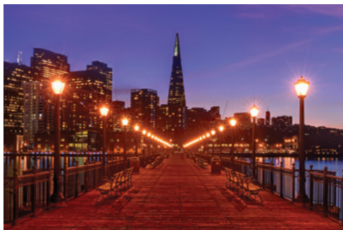
San Francisco—Panorama notturno

alle 16:00 utilizzando nel frattempo la stanza di cortesia per il deposito bagagli (costo indicativo Usd 10,00 a bagaglio depositato) per iniziare subito in autonomia la visita della città. Posizionare l'estensione a fine tour, a nostro avviso serve inoltre a far decongestionare i passeggeri in coda al viaggio dai ritmi del tour precedentemente effettuato. Sull'estensione a New York è possibile prenotare per il secondo giorno una visita guidata della città di circa 5 ore e 30 minuti al costo di € 60,00 a persona (partenza dell'escursione alle ore 09:00 dall'hotel Sheraton New York Times Square - possibilità di quotare in questo caso direttamente il predetto hotel come luogo di soggiorno per le 3 notti). Al contrario del costo del tour il cui prezzo è fisso e garantito, il costo dell'estensione a New York è da quotare in via definitiva sulla base del periodo di viaggio scelto, sulla base del costo dei soggiorni alberghieri (Alta stagione su tariffe alberghiere: aprile, maggio, giugno, settembre ed ottobre / Bassa stagione su tariffe alberghiere: luglio e agosto). All'arrivo a presso l'hotel all'atto del check-in potrebbe essere richiesta una carta di credito con numeri in rilievo (non vengono accettate le carte di credito ricaricabili ma solo quelle legate ad un conto corrente) a garanzia di danni e/o eventuali extra.