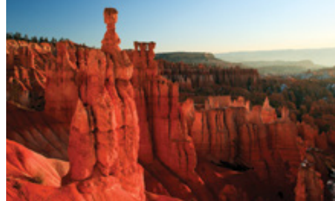
Las Vegas—Panorama Parco Nazionale del Bryce Canyon—Panorama

All'interno dei 76,518 acri del Parco sono conservati più di 2000 archi oltre a un'incredibile varietà di altre formazioni geologiche. Massicci, rocce, pinnacoli e guglie svettano maestosi sui visitatori intenti a esplorare il Parco dai più svariati punti di vista. Il più famoso degli archi è il Delicate Arch: per ammirarlo dovrete lasciare la strada principale e scendere per un sentiero. Durante la visita vi imbatteverete probabilmente in piccoli branchi di pecore bighorn, il cui colore del manto permette loro di mimetizzarsi col paesaggio. Al termine della visita proseguiamo per Moab, dove è previsto il pernottamento.