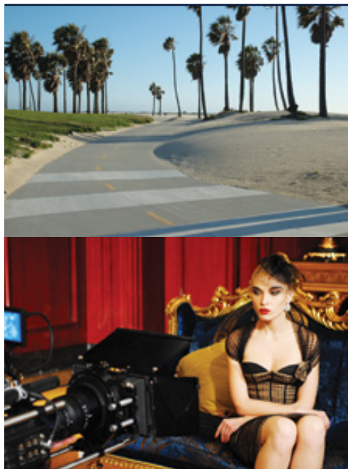
Le spiagge della California Los Angeles—Universal Studios

Date di partenza e prezzi pagina successiva »