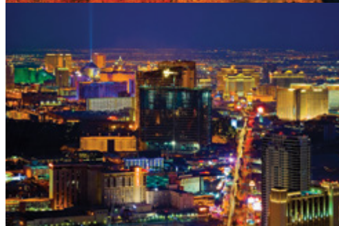
Parco Nazionale del Gran Canyon—Panorama Las Vegas—Panorama