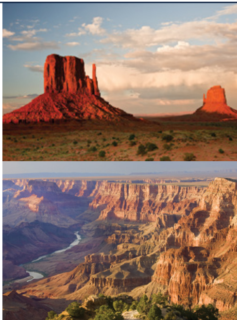
Parco Nazionale di Monument Valley Parco Nazionale del Grand Canyon—Panorama

Prima colazione, trasferimento autonomo in aeroporto per il volo di ritorno, possibilità di usufruire della navetta gratuita messa a disposizione dall’hotel.