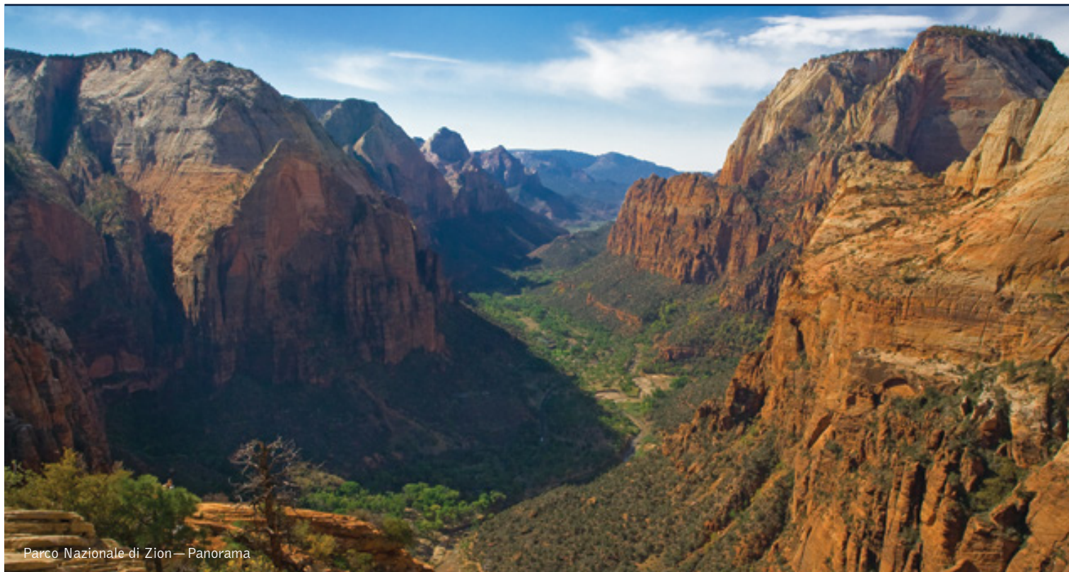
Parco Nazionale di Zion — Panorama

16 giorni /15 notti. Da giugno a settembre. Inizio/Fine tour: San Francisco/Los Angeles