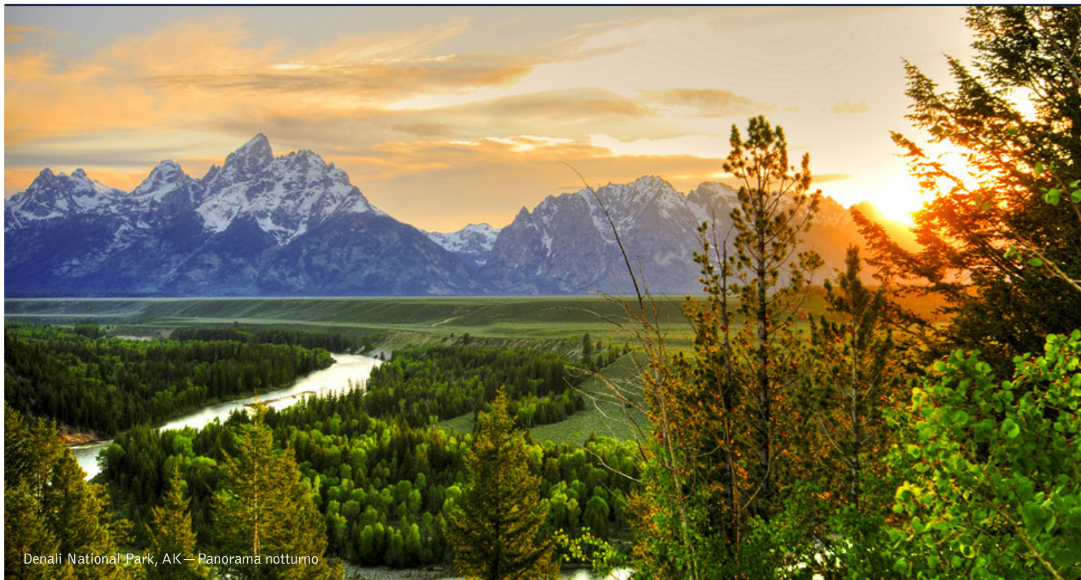
Denali National Park, AK — Panorama notturno

11 giorni / 10 notti. Da luglio ad agosto. Inizio/Fine tour: Anchorage, AK