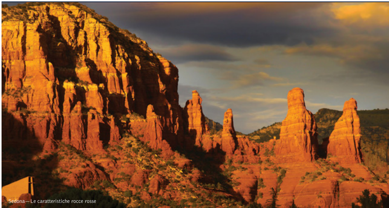
Sedona—Le caratteristiche rocce rosse

17 giorni / 16 notti. Da aprile a ottobre. Inizio/Fine tour: Los Angeles/San Francisco