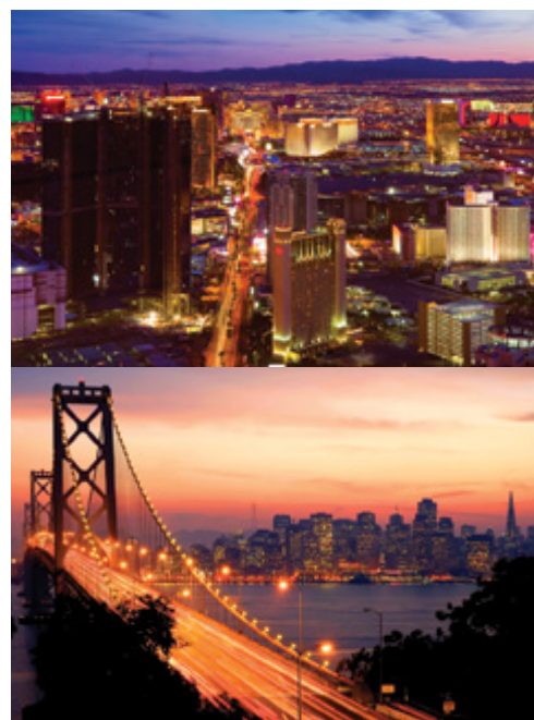
Las Vegas—Le mille luci dei casinò San Francisco—Il Golden Gate Bridge

(domenica—519 km) Colazione. Partenza per Zion, affascinante parco nazionale dove il fiume Virgin ha scavato il suo letto tra le solide rocce a strapiombo. Una gola profonda incorniciata dai colori rosso brillante e bianco delle maestose pareti rocciose