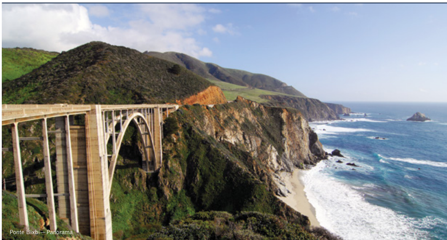
Ponte Bixbi — Panorama

18 giorni / 17 notti. Da maggio a ottobre. Inizio/Fine tour: Los Angeles/New York