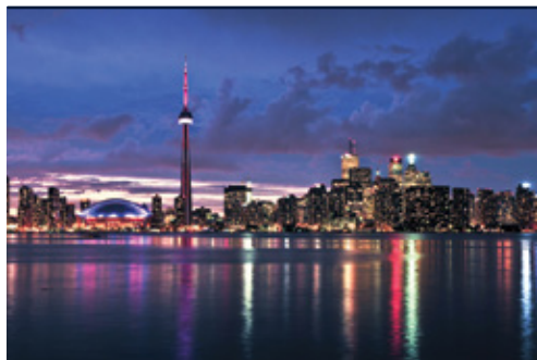
Tornoto — La skyline illuminata al tramonto San Francisco — Un caratteristico tram

Date di partenza e prezzi pagina successiva »