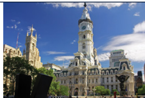
Philadelphia—La storica City Hall

Tariffe aeree nazionali/ internazionali; Quota d'iscrizione e assicurazione medico/