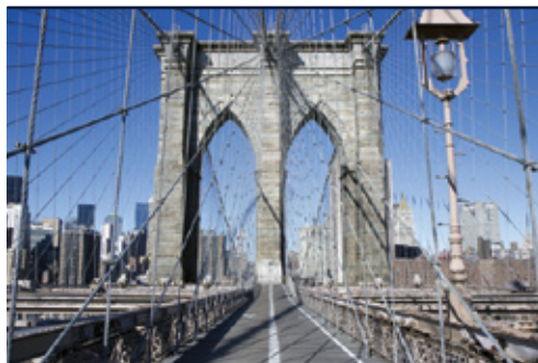
New York—Il ponte di Brooklyn

Date di partenza e prezzi pagina successiva »