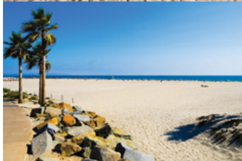
Santa Barbara—La spiaggia Costa californiana—La spiaggia

Square, con supplemento di Euro 190,00 a persona (vedere tabella prezzi); Pullman nuovi con aria condizionata; Visita di New York, Niagara Falls (lato canadese), giro orientativo di Toronto e visita di Washington; Facchinaggio in tutti gli alberghi; Ingressi: The Vessel, Museum of Modern Art o similare (escursioni libere senza accompagnatore), Battello Horneblower, Cimitero d'Arlington.