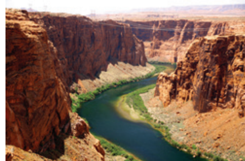
Parco Nazionale di Yosemite—Panorama Parco Nazionale del Grand Canyon—Panorama