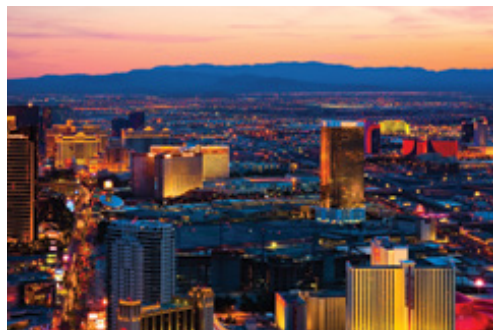
Las Vegas — Panorama al tramonto

Colazione. In mattina visita della splendida città di San Francisco, centro multiculturale un tempo nota