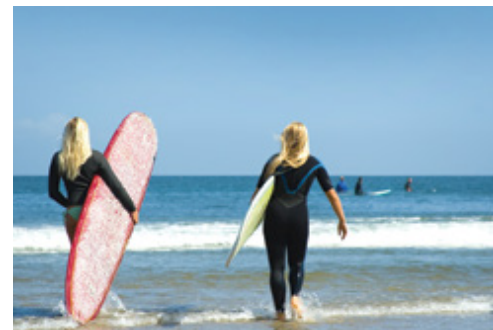
Los Angeles — La spiaggia di Malibu

di deposito dei bagagli (costo indicativo Usd 10,00 a bagaglio depositato), utilizzando a loro piacimento la giornata in città prima di tornare a prendere i bagagli per imbarcarsi poi sul volo per New York. In relazione all'arrivo a New York, qualora l'hotel non abbia una camera subito disponibile il passeggero dovrà attendere l'orario classico di check-in intorno alle 16:00 utilizzando nel frattempo la stanza di cortesia per il deposito bagagli (costo indicativo Usd 10,00 a bagaglio depositato) per iniziare subito in autonomia la visita della città. Posizionare l'estensione a fine tour, a nostro avviso serve inoltre a far decongestionare i passeggeri in coda al viaggio dai ritmi del tour precedentemente effettuato. Sull'estensione a New York è possibile prenotare per il secondo giorno una visita guidata della città di circa 5 ore e 30 minuti al costo di € 60,00 a persona (partenza dell'escursione alle ore 09:00 dall'hotel Sheraton New York Times Square — possibilità di quotare in questo caso direttamente il predetto hotel come luogo di soggiorno per le 3 notti). Al contrario del costo del tour il cui prezzo è fisso e garantito, il costo dell'estensione a New York è da quotare in via definitiva sulla base del periodo di viaggio scelto, sulla base del costo dei soggiorni alberghieri (Alta stagione su tariffe alberghiere: aprile, maggio, giugno, settembre ed ottobre / Bassa stagione su tariffe alberghiere: luglio e agosto).