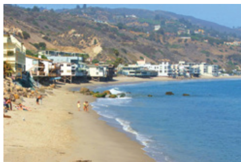
Los Angeles—La spiaggia di Malibu