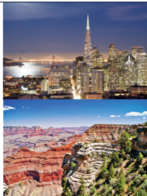
Parco Nazionale del Grand Canyon— Panorama San Francisco— Panorama

I Bambini vengono accettati dagli 8 anni compiuti. Le escursioni facoltative sono prenotabile e pagabili solo in loco, i prezzi sono soggetti a riconferma da parte della guida. Si devono considerare per autista di Usd 3,00 e per la guida di Usd 4,00 al giorno a persona da versare in loco a fine tour a titolo di mancia. La possibile estensione individuale a New York consigliamo di posizionarla successivamente al tour, adottando un volo di collegamento notturno tra Los Angeles e New York (esempio: partenza Los Angeles ore 23:59 ed arrivo il giorno dopo alle 08:20 a New York) Questa soluzione assolve la doppia funzione di far risparmiare una notte in hotel ed offrire giornate piene nella città di partenza (Los Angeles) e di destinazione (New York). In questo caso il check-out dall'hotel di Los Angeles avverrà verso le ore 11:00 e i passeggeri potranno utilizzare la stanza di deposito dei bagagli (costo indicativo Usd 10,00 a bagaglio depositato), utilizzando a loro piacimento la giornata in città