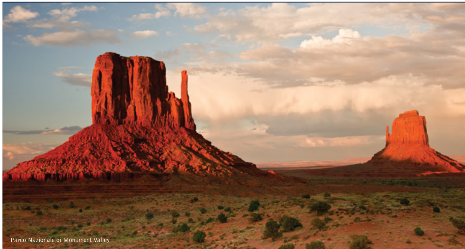
Parco Nazionale di Monument Valley

12 giorni / 11 notti. Da giugno a settembre. Inizio/Fine tour: Los Angeles/Las Vegas