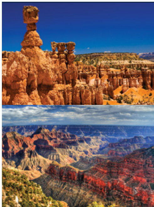
Parco Nazionale del Grand Canyon— Panorama

Date di partenza e prezzi pagina successiva »