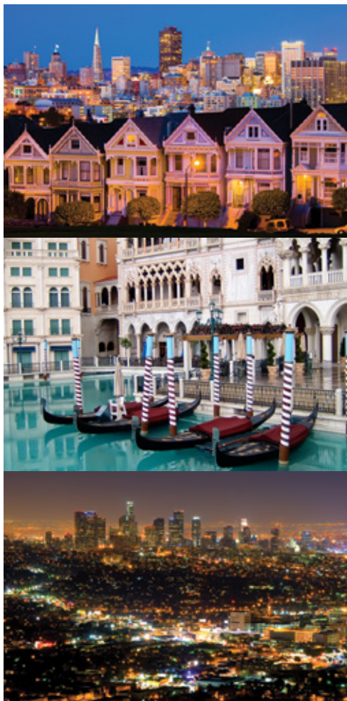
San Francisco— Las Vegas— Los Angeles— Panorama

Tariffe aeree nazionali/ internazionali; quota d'iscrizione e assicurazione medico/ bagaglio € 60 (ne vengono applicate massimo 2 per camera); I pasti, le bevande, gli extra in genere, le mance e tutto quanto non espressamente indicato nel programma; Spese personali come lavanderia, telefonate, escursioni facoltative, Facchinaggio in tutti gli hotel.