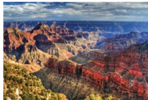
Parco Nazionale del Grand Canyon—Panorama

I Bambini vengono accettati dagli 8 anni compiuti. Le escursioni facoltative sono prenotabile e pagabili solo in loco, i prezzi sono soggetti a riconferma da parte della guida tranne che le "Tour notturno di New York" e "Bronx, Brooklyn e Queens" che devono essere prenotate dall'Italia prima della partenza. Per alberghi di prima categoria (Los Angeles, Las Vegas, San Francisco e New York) si intendono strutture ricettive assimilabili ad hotels 4 stelle, per alberghi di categoria turistica (aree parchi nazionali) si intendono strutture ricettive assimilabili ad hotels 3 stelle. L'hotel di New York ovvero il Riu Plaza Times Square è sempre garantito quale albergo utilizzato e non soggetto quindi alla formula "o similare". In caso di pioggia intensa, Antelope Canyon potrebbe essere chiuso per motivi di sicurezza a causa di inondazioni improvvise (Forza Maggiore). Per partecipare alle escursioni facoltative "Tour notturno di New York" e "Bronx, Brooklyn e Queens" i passeggeri devono recarsi all'ingresso dell'hotel Sheraton Times Square agli orari sopra riportati nella descrizione delle predette escursioni, che dista circa 800 metri a piedi dall'hotel Riu Plaza Times Square. Si devono considerare per autista di Usd 3,00 e per la guida di Usd 4,00 al giorno a persona da versare in loco a fine tour a titolo di mancia.