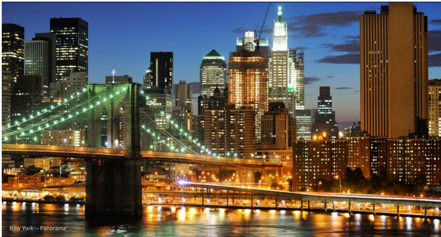
New York — Panorama

20 giorni / 19 notti. Da giugno a settembre. Inizio/Fine tour: Los Angeles/New York