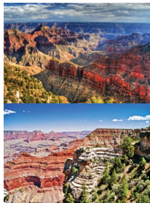
Parco Nazionale del Grand Canyon—Panorama

e garantito, il costo dell'estensione a New York è da quotare in via definitiva sulla base del periodo di viaggio scelto, sulla base del costo dei soggiorni alberghieri (Alta stagione su tariffe alberghiere: aprile, maggio, giugno, settembre ed ottobre / Bassa stagione su tariffe alberghiere: luglio e agosto).