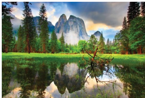
Parco Nazionale dello Yosemite

Prima colazione (con supplemento). Dedicate la mattinata alla scoperta di una delle più belle città d'America. Da non perdere Union Square, Chinatown, il Golden Gate Park e Fisherman's Wharf, con la vista sulla famigerata isola di Alcatraz, dall'altra parte della baia. Pomeriggio libero con possibilità di prendere parte all'escursione facoltativa alla scoperta del caratteristico villaggio di Sausalito.