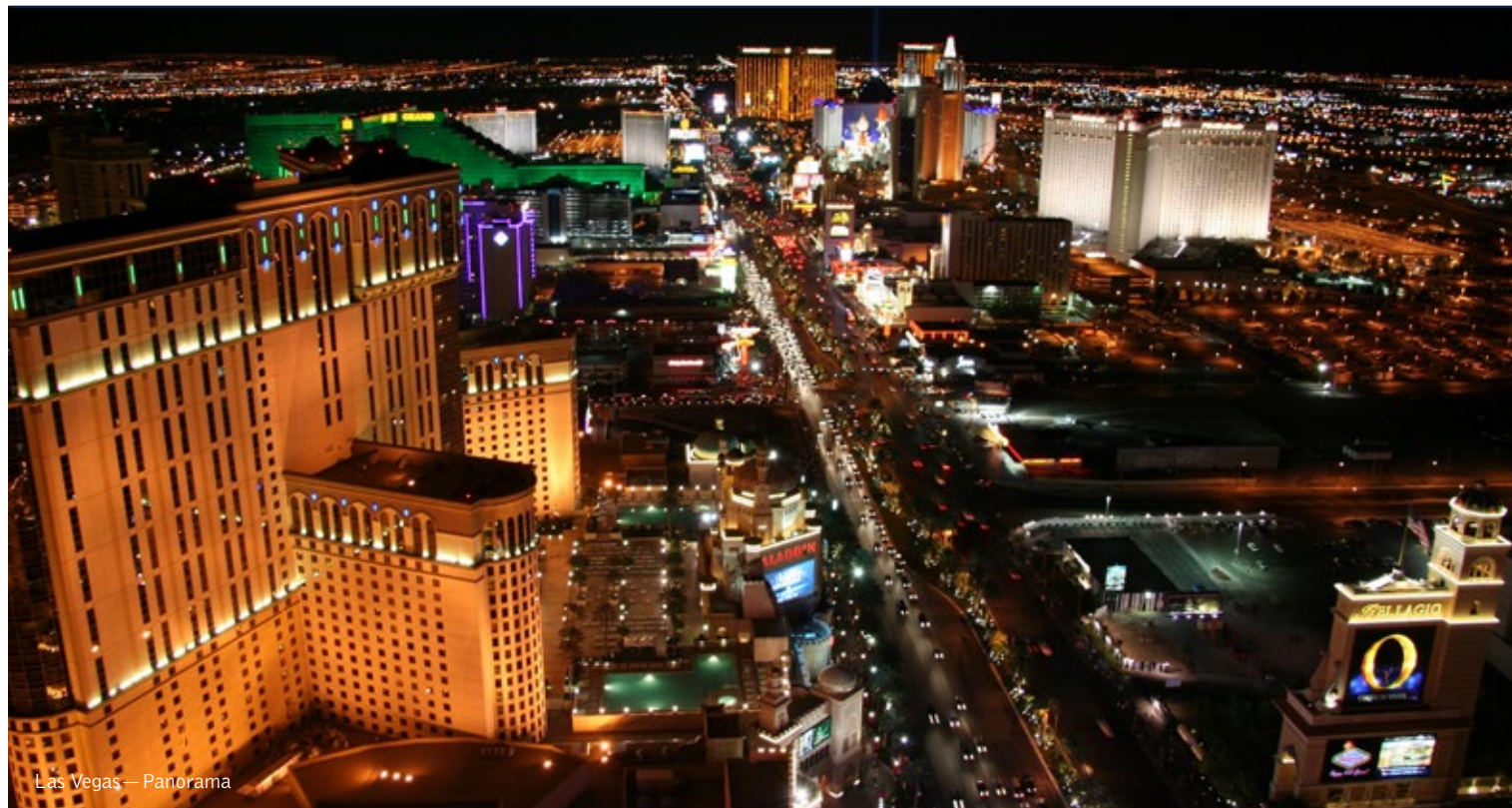
Las Vegas — Panorama

16 giorni / 15 notti. Da giugno a settembre. Inizio/Fine tour: Los Angeles/ San Francisco