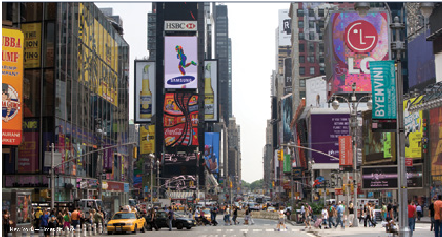
New York — Times Square

8 giorni / 7 notti. Da giugno a settembre. Inizio/Fine tour: New York