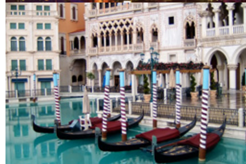
Las Vegas — Panorama Las Vegas — Gli hotel