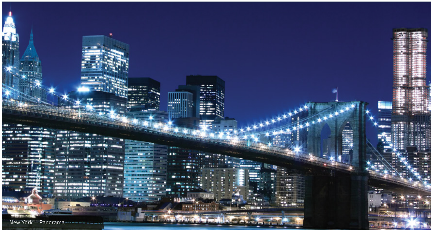
New York — Panorama

14 giorni / 13 notti. Da giugno a settembre. Inizio/Fine tour: Las Vegas/New York