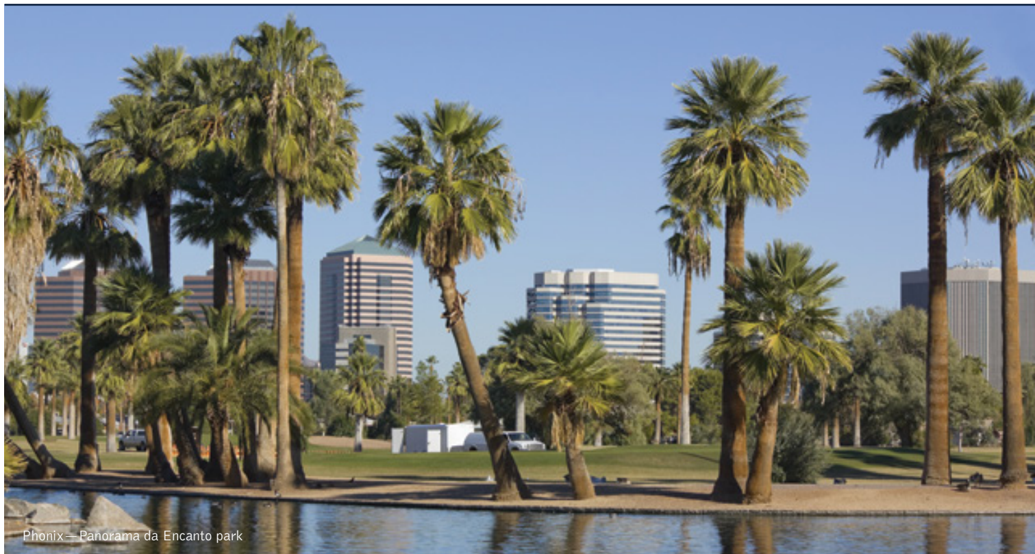
Phoenix—Panorama da Encanto park

10 giorni / 9 notti. Da giugno a settembre. Inizio/Fine tour: Las Vegas