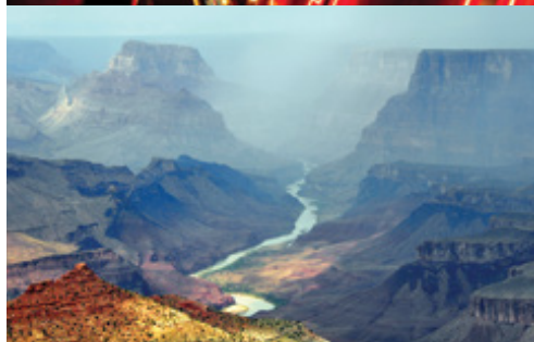
photo: Las Vegas—Gli hotel Parco Nazionale del Grand Canyon—Panorama