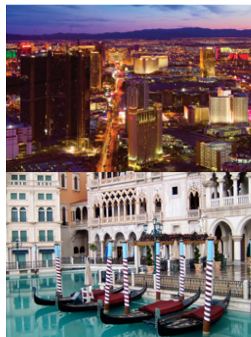
Las Vegas—Panorama Las Vegas—Gli hotel

Al contrario del costo del tour il cui prezzo è fisso e garantito, il costo dell'estensione a New York è da quotare in via definitiva sulla base del periodo di viaggio scelto, sulla base del costo dei soggiorni alberghieri (Alta stagione su tariffe alberghiere: aprile, maggio, giugno, settembre ed ottobre / Bassa stagione su tariffe alberghiere: luglio e agosto).