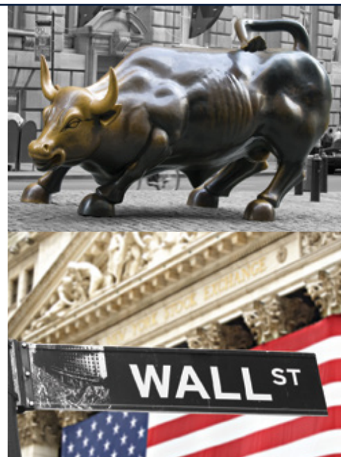
New York—Wall Street e il Charging Bull

e i passeggeri potranno utilizzare la stanza di deposito dei bagagli (costo indicativo Usd 10,00 a bagaglio depositato), utilizzando a loro piacimento la giornata in città prima di tornare a prendere i bagagli per imbarcarsi poi sul volo per New York. In relazione all'arrivo a New York, qualora l'hotel non abbia una camera subito disponibile il passeggero dovrà attendere l'orario classico di check-in intorno alle 16:00 utilizzando nel frattempo la stanza di cortesia per il deposito bagagli (costo indicativo Usd 10,00 a bagaglio depositato) per iniziare subito in autonomia la visita della città. Posizionare l'estensione a fine tour, a nostro avviso serve inoltre a far decongestionare i passeggeri in coda al viaggio dai ritmi del tour precedentemente effettuato.