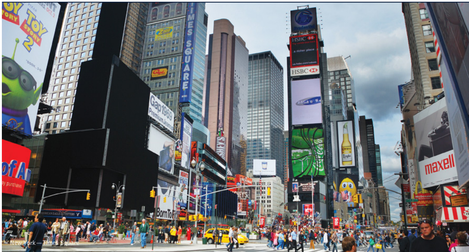
New York — Times Square

16 giorni / 15 notti. Da giugno a settembre. Inizio/Fine tour: Los Angeles/New York