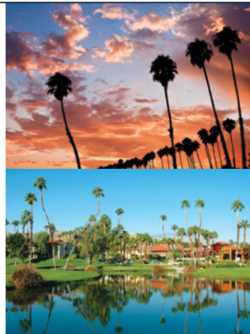
Santa Barbara—Il tramonto Palm Springs—Panorama