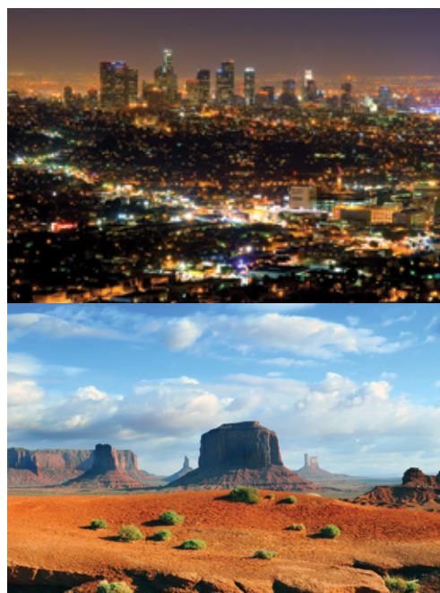
Los Angeles—Panorama notturno Parco Nazionale di Monument Valley

Colazione americana. Giornata libera a disposizione. [Escursione facoltativa] Bronx, Brooklyn e Queens — È il tour che vi fa scoprire l'autentica New York, fatta delle tante etnie e lingue che danno vita al 'melting pot' (per partecipare a questa escursione i passeggeri devono recarsi autonomamente all'ingresso dell'hotel Sheraton Times Square alle ore 08:30, circa 800 metri a piedi dall'hotel Riu Plaza Times Square).