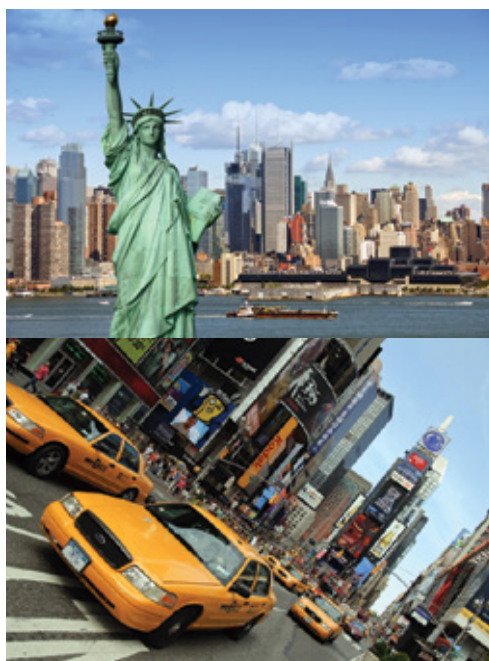
New York—La Statua della Libertà New York—Times Square

Questa soluzione assolve la doppia funzione di far risparmiare una notte in hotel ed offrire giornate piene nella città di partenza (San Francisco) e di destinazione (New York). In questo caso il check-out dall'hotel di San Francisco avverrà verso le ore 11:00