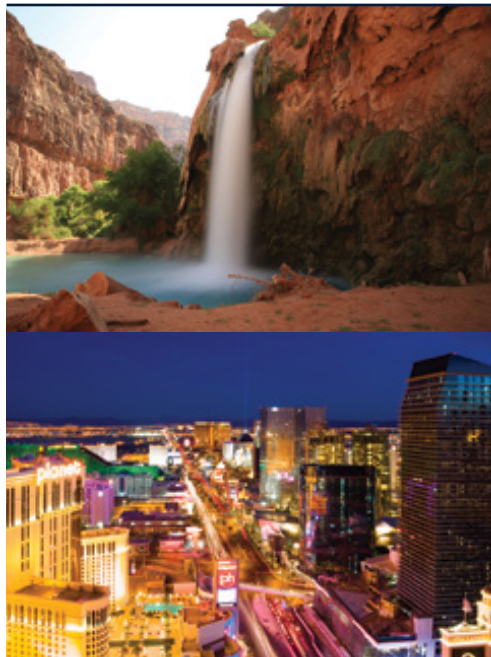
Parco Nazionale del Grand Canyon—Cascata Las Vegas—le mille luci dei casinò

Date di partenza e prezzi pagina successiva »