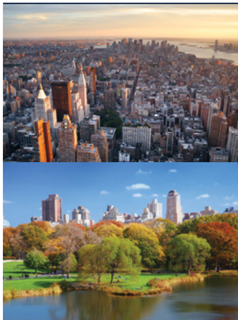
New York—Panorama New York—Central Park

Date di partenza e prezzi pagina successiva »