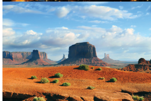
Los Angeles—Panorama notturno Parco Nazionale di Monument Valley