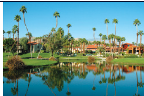
Santa Barbara—Il tramonto Palm Springs—Panorama