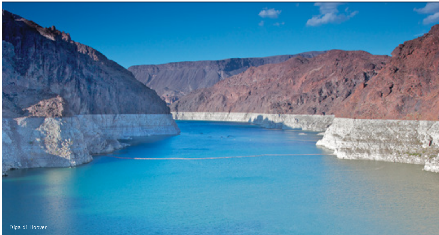
Diga di Hoover

12 giorni / 11 notti. Da aprile a ottobre. Inizio/Fine tour: Los Angeles/San Francisco