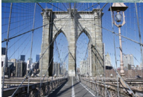
Cascate del Niagara New York—Il ponte di Brooklyn