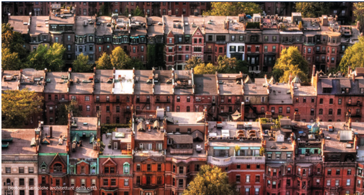
Boston — Le tipiche architetture della città

12 giorni / 11 notti. Da giugno a settembre. Inizio/Fine tour: New York