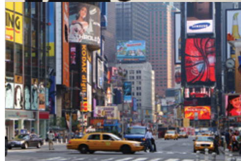
Washington — Il cimitero di Arlington New York — Times Square