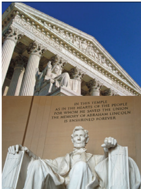
Washington—La Corte Suprema

Date di partenza e prezzi pagina successiva »