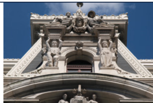
Philadelphia, PA—La torre dell'orologio della City Hall

Prima colazione (con supplemento). Partenze individuali e trasferimenti in aeroporto.