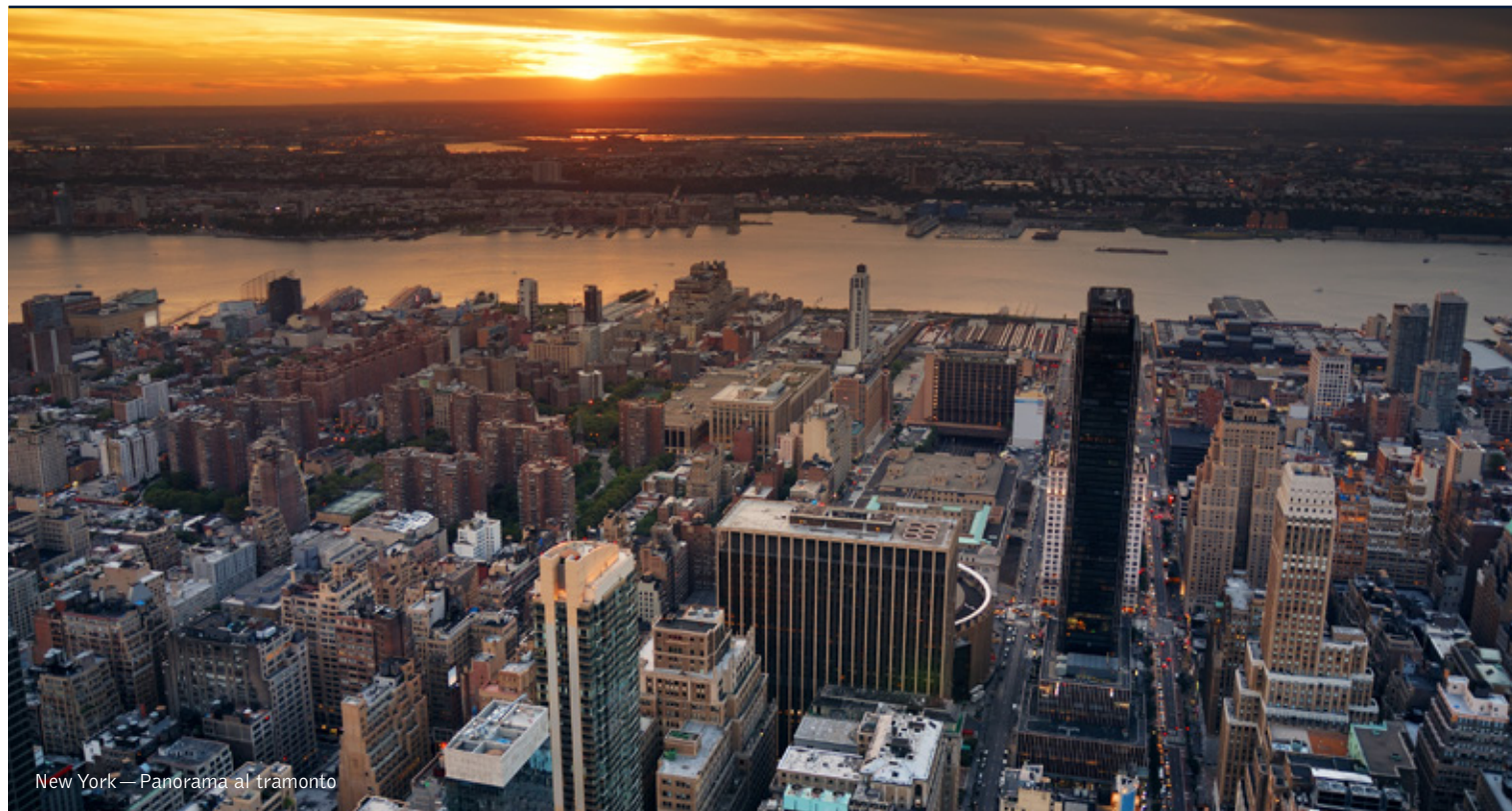
New York—Panorama al tramonto

8 giorni / 7 notti. Da aprile a ottobre. Inizio/Fine tour: New York