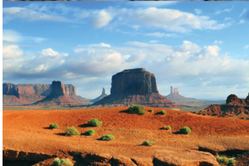
Phoenix — Panorama da Encanto park Parco Nazionale di Monument Valley

Bryce Canyon, dove i vostri occhi saranno stregati da un mondo fatto di pinnacoli multicolore, gli Hoodoos. La sera, tempo permettendo, osservate lo spettacolare cielo notturno e di respirate a pieno l'aroma proveniente dai falò che bruciano legno di pino.