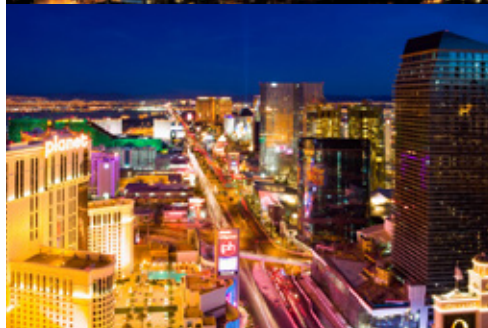
Los Angeles — Panorama notturno Las Vegas — Panorama notturno