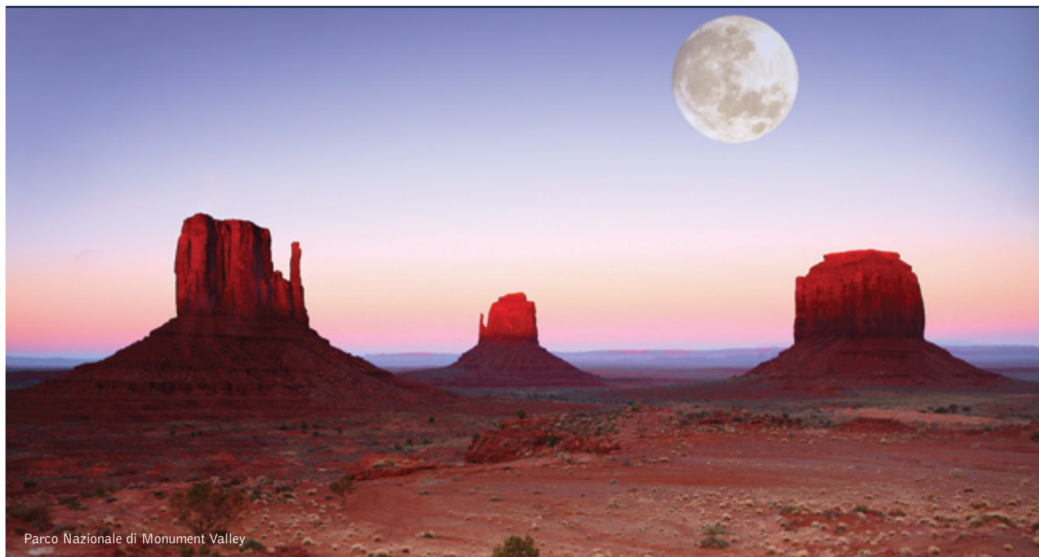
Parco Nazionale di Monument Valley

9 giorni / 8 notti. Da maggio a ottobre. Inizio/Fine tour: Los Angeles