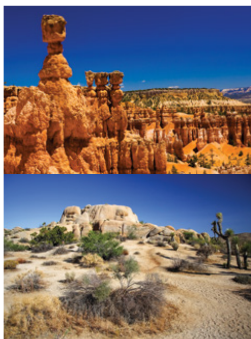
Parco Nazionale del Bryce Canyon—Panorama California—Parco Nazionale di Joshua Tree