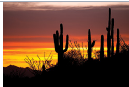
Williams — Il deserto popolato di cactus saguaro

Tariffe aeree nazionali/ internazionali; Trasferimento hotel — aeroporto — aeroporto; Notte post tour a Los Angeles; Quota d'iscrizione e assicurazione medico/ bagaglio € 60; 1 pasti, le bevande, gli extra in genere, le mance e tutto quanto non espressamente indicato nel programma; Spese personali come lavanderia, telefonate, escursioni facoltative.