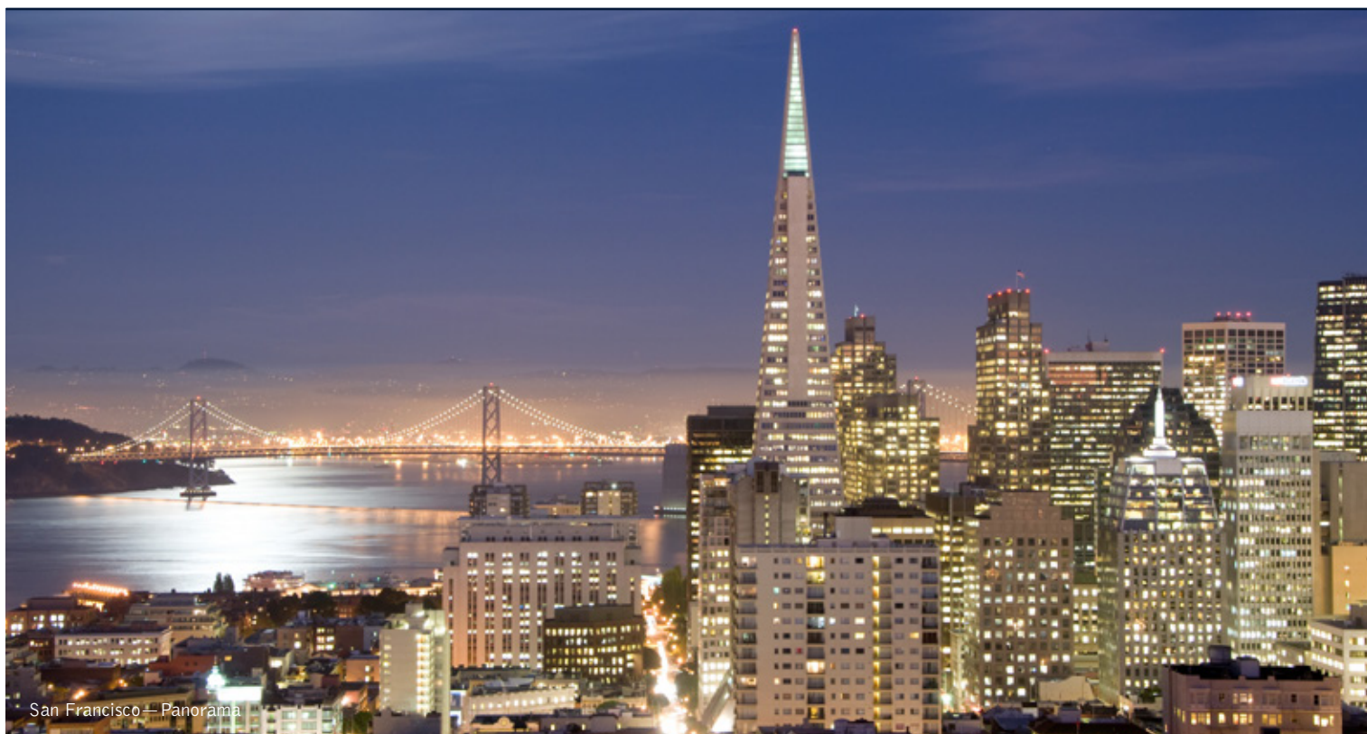
San Francisco — Panorama

8 giorni / 7 notti. Da aprile a ottobre. Inizio/Fine tour: Los Angeles/Las Vegas