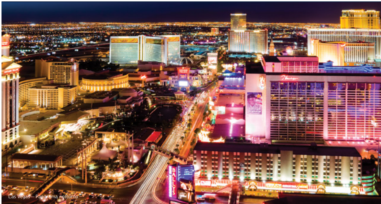
Las Vegas — Panorama notturno

12 giorni / 11 notti. Da maggio a ottobre. Inizio/Fine tour: Los Angeles/San Francisco