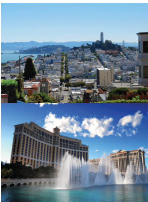
San Francisco—Panorama Las Vegas—I casinò

Al contrario del costo del tour il cui prezzo è fisso e garantito, il costo dell'estensione a New York è da quotare in via definitiva sulla base del periodo di viaggio scelto, sulla base del costo dei soggiorni alberghieri (Alta stagione su tariffe alberghiere: aprile, maggio, giugno, settembre ed ottobre / Bassa stagione su tariffe alberghiere: luglio e agosto). In alcuni hotel potrebbe essere richiesta la carta di credito all'atto del check-in a garanzia.