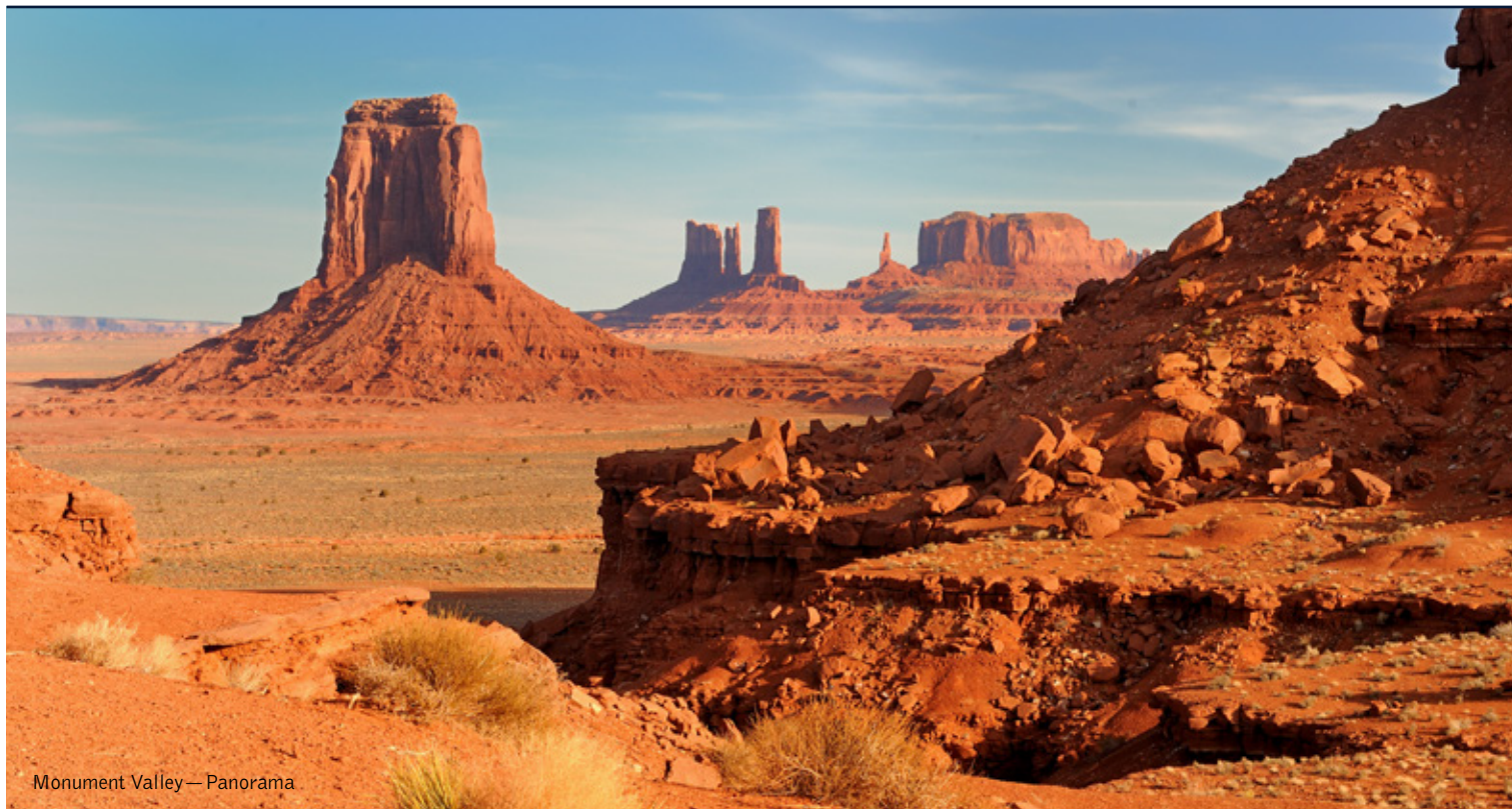
Monument Valley — Panorama

13 giorni / 12 notti. Da aprile a ottobre. Inizio/Fine tour: Los Angeles/New York