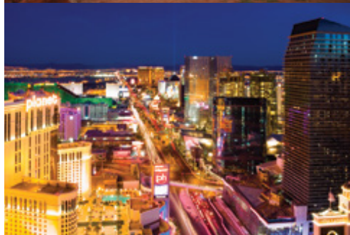
Parco Nazionale del Grand Canyon—Cascata Las Vegas—le mille luci dei casinò

il quartiere di Hells Kitchen con le sue strade alberate e ci dirigeremo verso la nuovissima zona della città, Hudson Yards, il più grande riassetto urbano al mondo con una spesa di oltre 25 miliardi. Hudson Yards confluisce con l'Highline e possiede due delle nuove icone di NY: un centro culturale che si espande a seconda del tipo di eventi (The Shed) e The Vessel, un monumento alla città più vibrante del pianeta. Salita sul The Vessel, "la scalinata di New York", nuova, splendida attrazione in acciaio e bronzo di 46 metri di altezza: 154 scale connesse tra di loro con 2500 gradini a nido d'ape. Dalle 80 piattaforme panoramiche lo spettacolo è garantito! (in caso di maltempo proveremo a rischedulare la salita, non è comunque previsto il rimborso) Visita del MoMA (senza accompagnatore): il Museo d'Arte Moderna contiene la più grande e influente collezione d'arte moderna al mondo che ha influenzato intere generazioni di pittori e amanti dell'arte. Pernottamento in albergo.